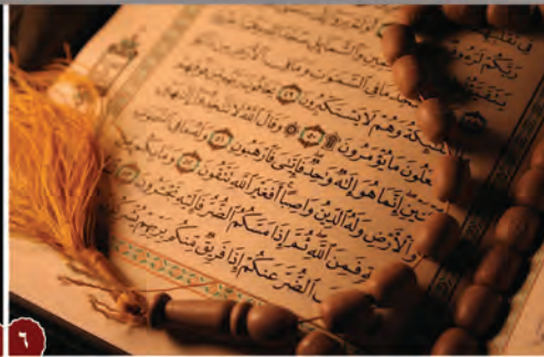
عالم الذر في القرآن والسنة