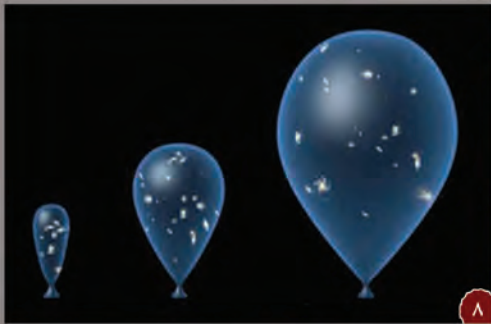
الاعجاز القرآني / تمدد الكون