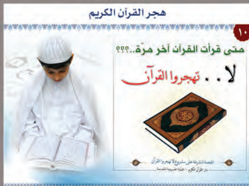
هجر القرآن الكريم