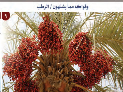
وفواكه مما يشتهون / الرطب

الهيئة للنشر على مشروع لا تهجروا القرآن دار القرآن الكريم - هيئة المشيخة القومية