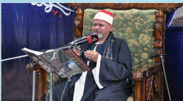
دار القرآن الكريم تقيم أمسية قرآنية رمضانية